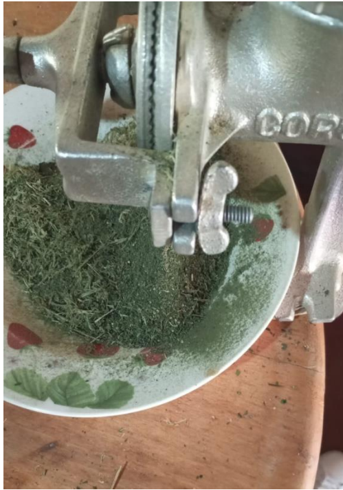
Figura 4. Obtención de la harina de ortiga