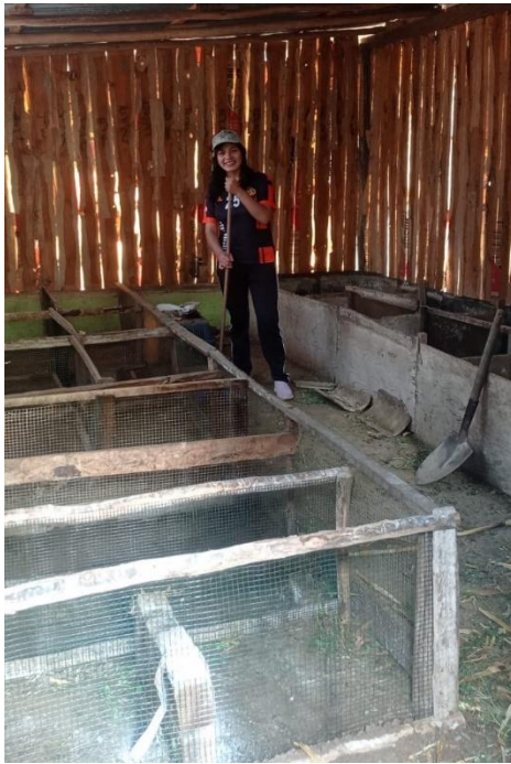
Figura 2. Limpieza del galpón