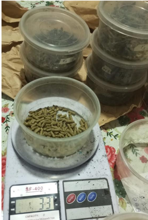
Figura 6. Racionamiento de alimento por tratamiento