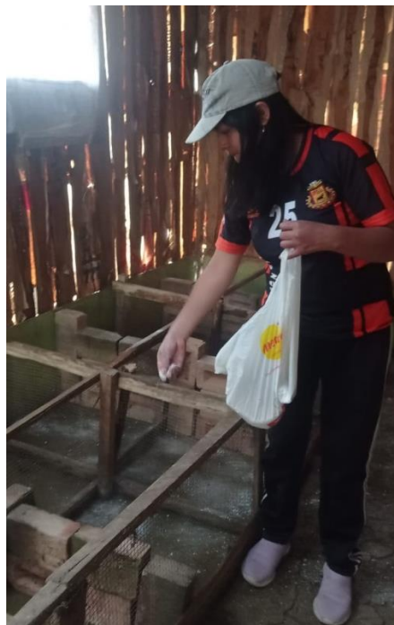
Figura 3. Encalado de las pozas