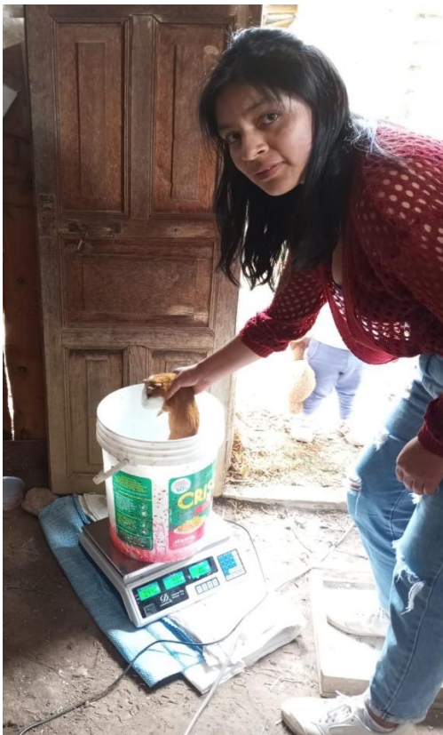
Figura 5. Pesado de los cuyes