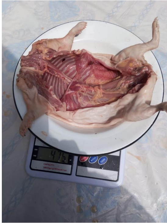
Figura 8. Carcasa de cuy