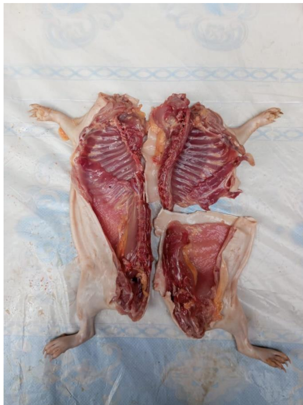
Figura 9. Piezas nobles de cuy