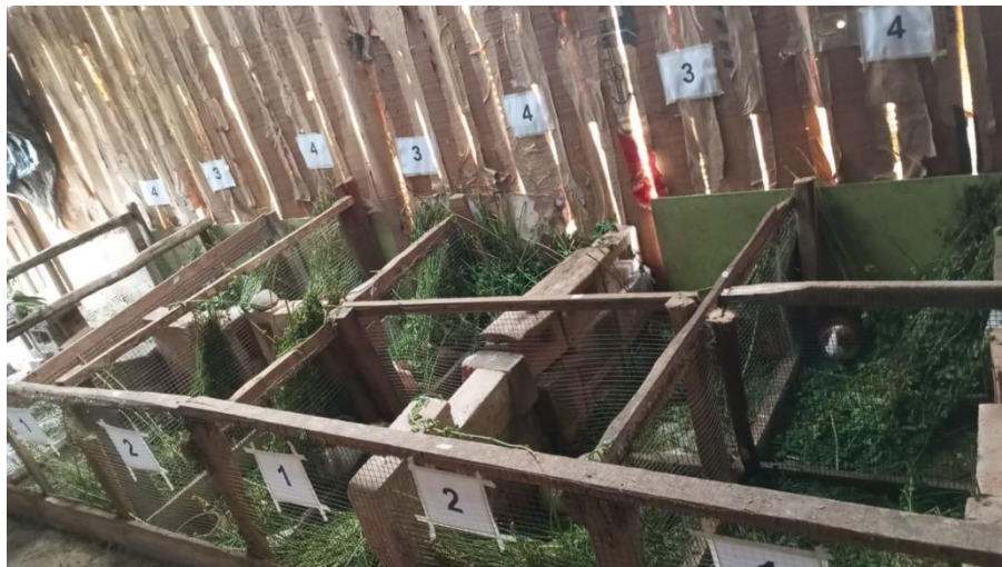
Figura 7. Pozas en investigación