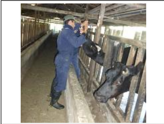
Fig. 5. Dosificación vía oral.