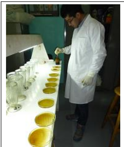
Fig. 12. Teñido del sedimento con lugol.