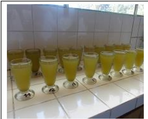
Fig. 10. Sedimentación de las muestras.