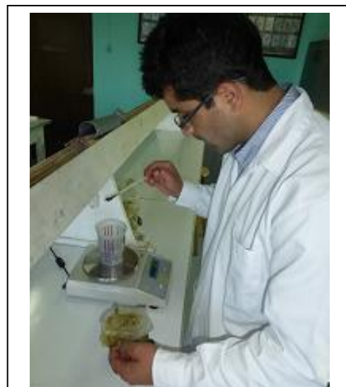
Fig. 7. Pesando 1 g de heces.