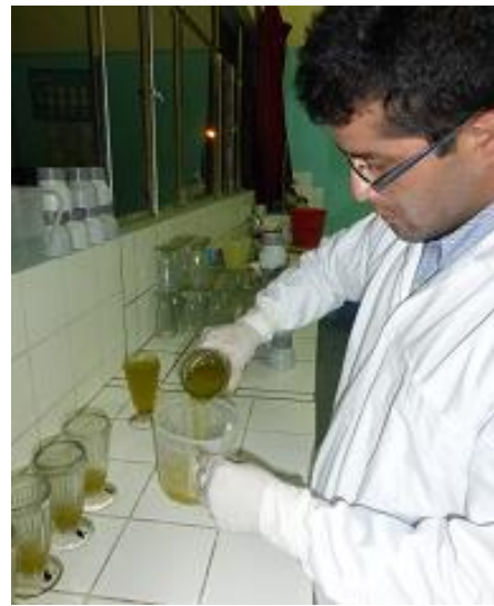
Fig. 11. Decantación de la muestra.