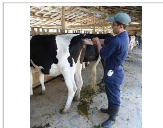
Fig. 4. Extracción muestra de heces del recto.