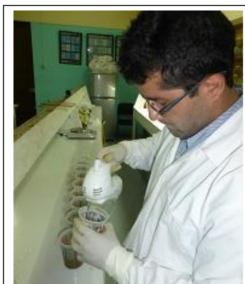
Fig. 8. Homogenizando la muestra.