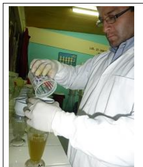
Fig. 9. Filtrando la muestra.