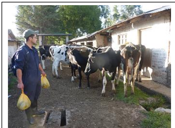
Fig. 1. Localización: San Vicente-valle Cajamarca.

Anexo 1. Figuras que datan la localización del trabajo de investigación, material biológico y la metodología utilizada en campo en 1ra. 2da. y 3ra. visitas al Fundo San Vicente.