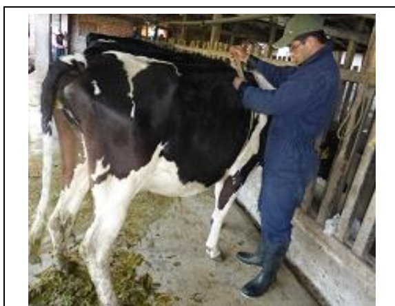
Fig. 3. Cálculo del peso con cinta bovinométrica.