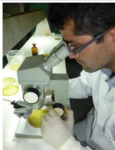
Fig. 13. Observación en estereoscopio.