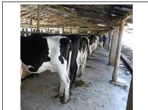
Fig. 2. Material biológico: Vacunos Holstein.